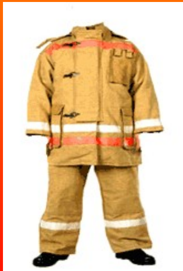
Боевая одежда пожарного