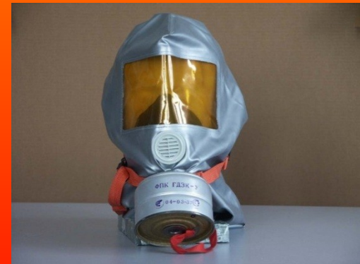
Маска - противогаз